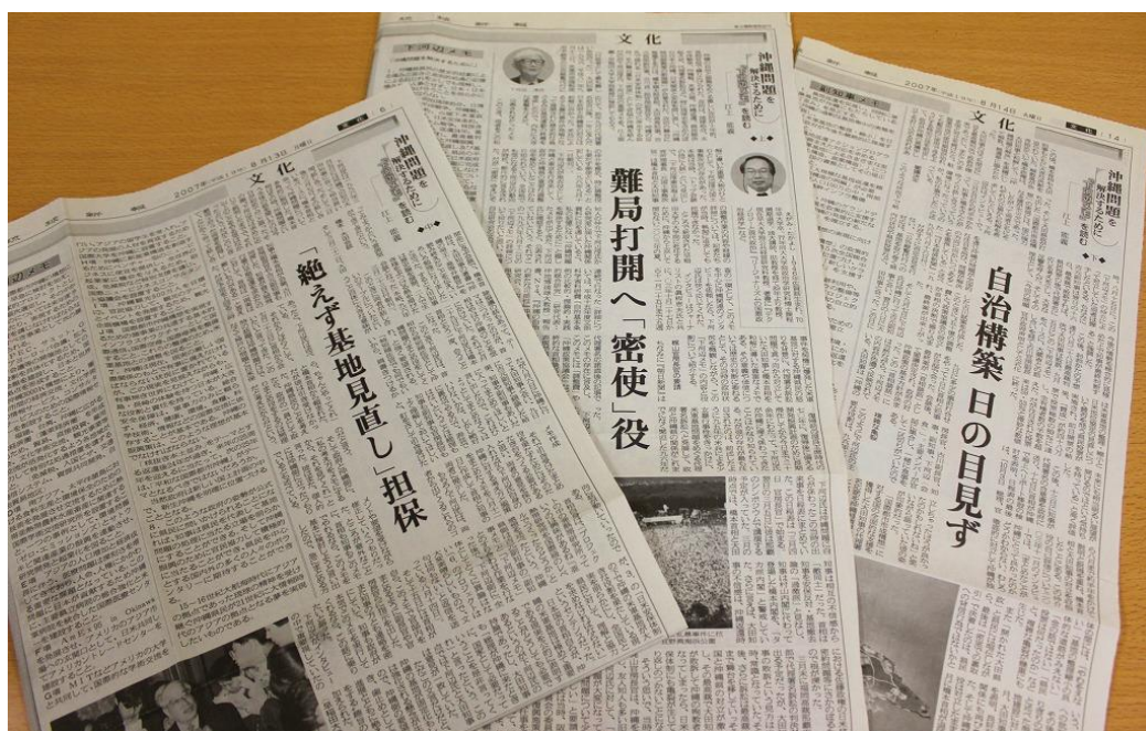
琉球新報に掲載された江上氏の論説「沖縄問題を解決するために一下河辺メモを読む」

そして下河辺氏のメモとインタビューを振り返るたびに、沖縄問題を解決することがいかに困難であるのか、今でも痛感させられるのである。