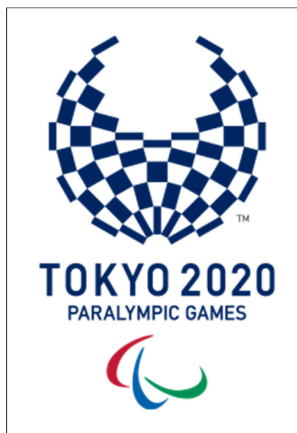
図 東京2020パラリンピック 大会エンブレム